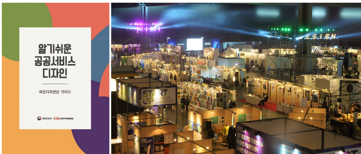
2019년 공공디자인가이드북(왼쪽) | ‘2018 디자인코리아’ 행사(오른쪽)

국제화와 디자인경영 시대에 발맞추어, 한국디자인포장센터는 산업디자인포장개발원(1991), 한국산업디자인진흥원(1997), 한국디자인진흥원(2001)으로 개칭하며 조직과 사업 범위를 변화시켜 나갔다. 더욱이, 2000년대 들어서는 더는 정부 주도의 디자인 진흥이 무의미해질 만큼 기업의 디자인 경쟁력이 발전해 있었다. 한국디자인진흥원은 기업에 디자인을 직접 지원하는 대신, 해외시장조사, 조사연구, 정보화, 인력양성과 교육, 디자인 컨설팅사업 등 간접지원사업 형태로 전환되었다. 또 2000년 이후 세계그래픽디자인대회(ICO-GRADA, 2000), 세계산업디자인총회(ICSID, 2001) 개최, 산업디자인진흥대회, 디자인코리아 행사 등 굵직한 국내외 디자인 행사를 개최하며 국내를 넘어 세계와 교류하고 협력하는 디자인 정책기관으로 발돋움해 나갔다.