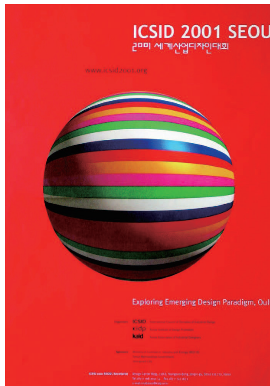
201 세계산업디자인대회(ICSID) 포스터

1980년대 후반부터 국내 디자인계에 많은 변화가 일어났다. 1987년, ‘국제저작권협약(Universal Copyright Convention)’에 가입하면서 해외 디자인 표절에 대한 경각심을 일깨웠고, 1990년대 시작된 WTO(World Trade Organization) 체제와 시장 개방 등으로 국내에 해외 유명 상품들이 범람했다. 이 시기, 삼성·LG·현대 등 대기업은 국제 경쟁력 강화를 목적으로 ‘디자인경영’을 천명하고 고유 브랜드와 독자적인 디자인을 개발하기 시작했다. ‘애니콜(Anycall)’, ‘쏘나타(SONATA)’ 등과 같은 글로벌 히트상품이 속속 등장했고 디자인경영은 기업들 사이에 성공적으로 안착되었다. 1990년대로 접어들면서 거의 모든 기업에 디자인경영 열풍이 불어, 디자인연구소가 설치되고 디자인 전공자가 대거 임원급으로 발탁되는 등 한국디자인의 체질적인 변화와 급속한 발전이 이루어졌다.