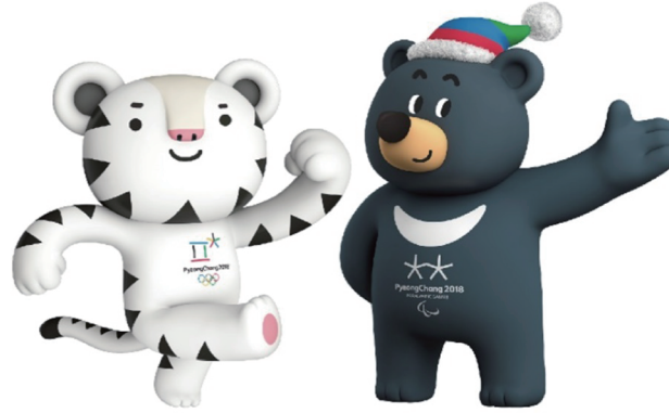
평창동계올림픽 마스코트 수호랑과 반다비