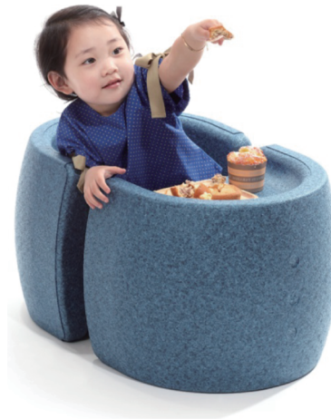
유아용 다용도 의자 | 디자인바이

우수디자인전문회사는 2012년부터 매년 선정해 왔으며, 정부는 한국을 대표하는 세계적인 경쟁력을 갖춘 디자인 기업으로 성장할 수 있도록 다양한 지원책을 마련해 나갈 방침이다.