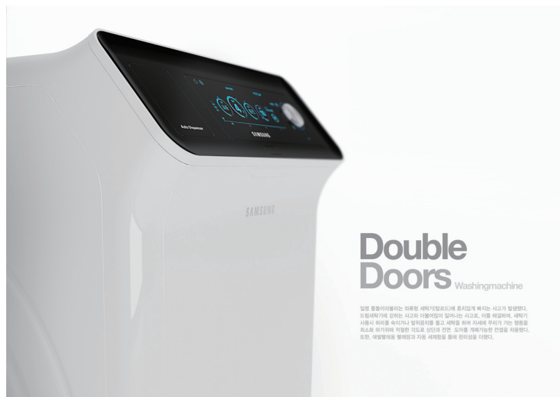
2017 레드닷디자인공모전 최고상 'Double doors', 세탁기에 갈하는 사고를 방지하기 위해 문을 개선한 세탁기

이 밖에 KDM 학생 작품이 세계 3대 디자인상의 하나인 독일 레드닷(Red-dot) 디자인공모전에서 최고상(Best of Best)을 수상하였으며, 지역사회 공헌활동의 일환으로 진행된 디자인 재능기부도 지역 산업계의 관심이 높다. 대전지역 중소기업