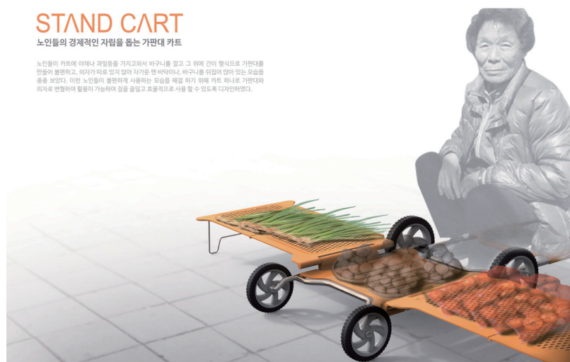
2017 레드닷디자인공모전 최고상 'Stand Cart', 노점 상인의 편의를 고려한 가판대

노인들이 커트에 야채나 과일등을 가지고와서 바구니를 들고 그 뒤에 간이 행선으로 가판대를 만들어 불편하고, 외자가 따로 있지 않아 차가운 맨 바리어나, 바구니를 뒤집어 앉아 있는 모습을 종종 보았다. 이런 노인들이 불편하게 사용하는 모습을 해결 하기 위해 카트 하나를 가판대라 외자로 변형하여 활용이 가능하여 값을 줄이고 효율적으로 사용할 수 있도록 디자인하였다.