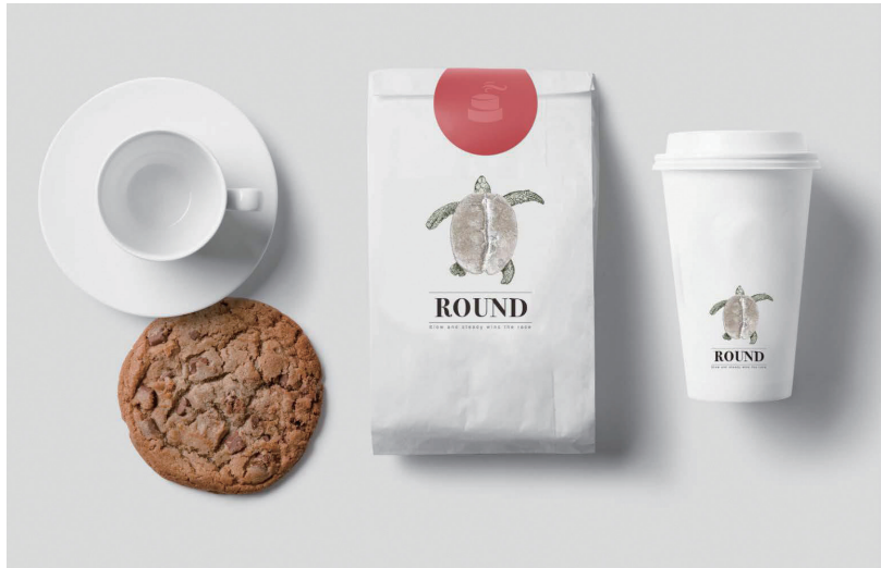
KDM 학생들의 도움으로 개선된 라운드커피 BI