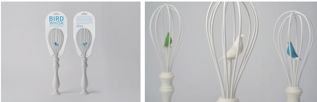
아이디어랩의 새 장 모양 거품기

학생 때 이미 아이디어랩(Eyedeal LAB)을 창업한 김완기(한남대 제품디자인)씨는 새장 모양의 거품기(Bird Whisk)로 국내 중소기업과 라이센스 계약을 체결하여 초기 생산물량 5,000개를 모두 납품하기도 했다. 지난 연말에는 유럽 납품에도 성공하여 현재 이탈리아와 프랑스에서도 판매되고 있다. 얼마전 폐막한 평창올림픽 이벤트 홍보 용품이었던 스노우볼과 LED응원봉도 김완기씨의 작품이다.