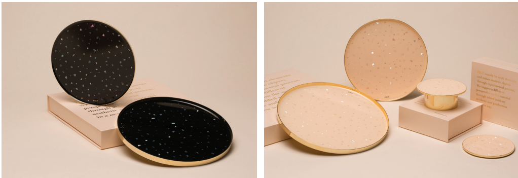
픽트의 자개 소반