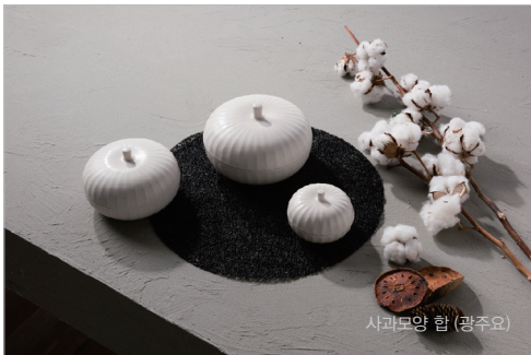
사과모양 합 (광주요)