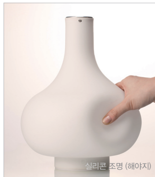
실리콘 조명 (해아지)