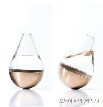
오독이 화병 (비믹스)

이 외에도 손목시계(프롬헨스), 캔들홀더(코몬드), 마블비누(모트), 트레이(파운드파운드), 실리콘 조명(해아지) 등 심플하지만 고급스럽고 세련된 디자인 제품에도 파리지앵들의 관심이 상당했다.