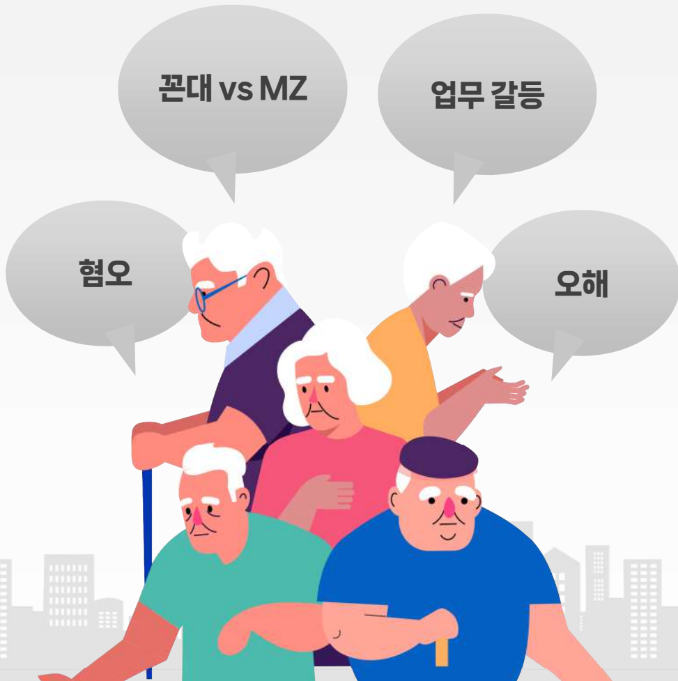
세대 갈등 인식 (통계청)