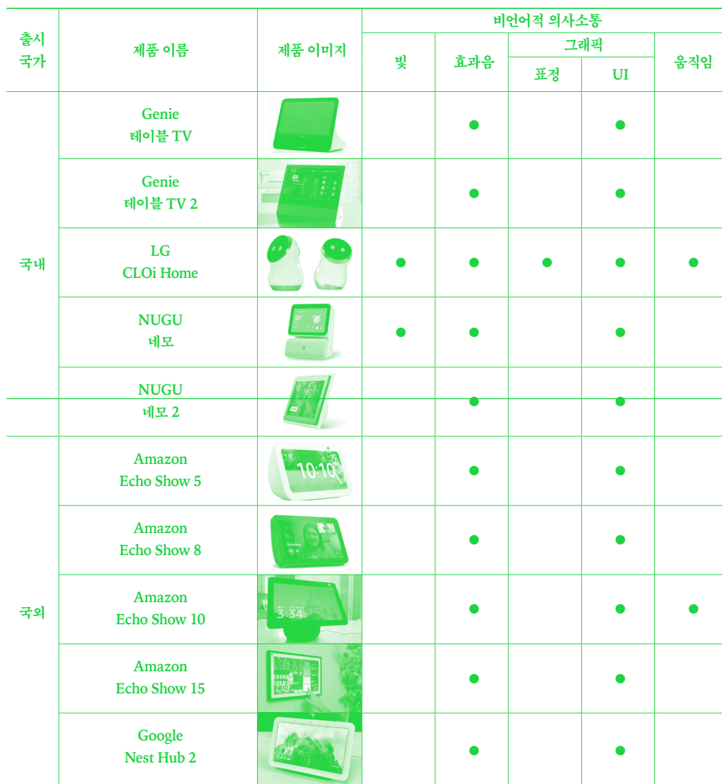
[표 3] 국내의 스마트 스피커의 비언어적 의사소통 활용 현황