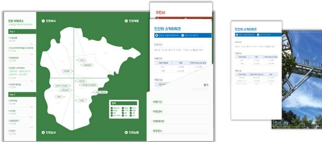
<'다 담은 단양' 리플렛에 카드 형식의 관광 정보를 지니는 형태>

카드 형식을 통해 가볍게 들고 다닐 수 있도록 - 카드 형식을 통해 관광객이 필요한 관광 정보를 콧아서 들고 다닐 수 있도록 하였습니다.