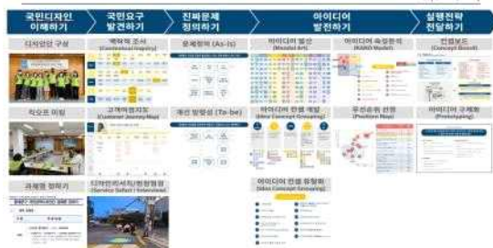
국민정책디자인단 추진 프로세스