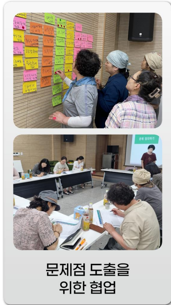
문제점 도출을 위한 협업