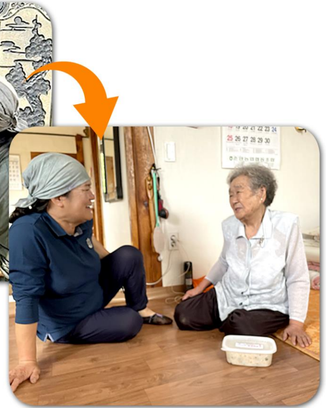
• 배달 •