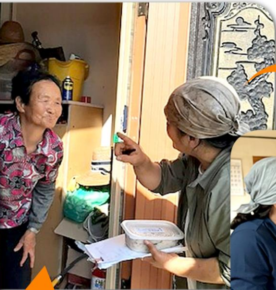
• 배송 •