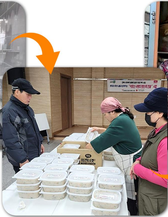
• 포장 •