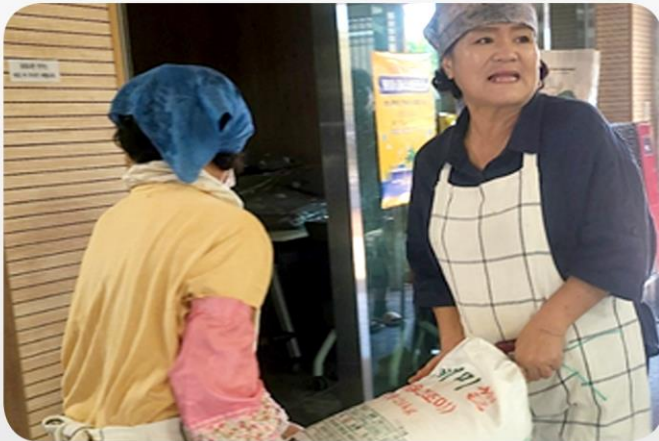
죽 재료 확보