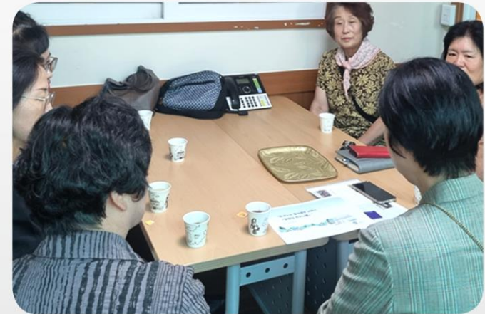
봉사 회원들의 열정