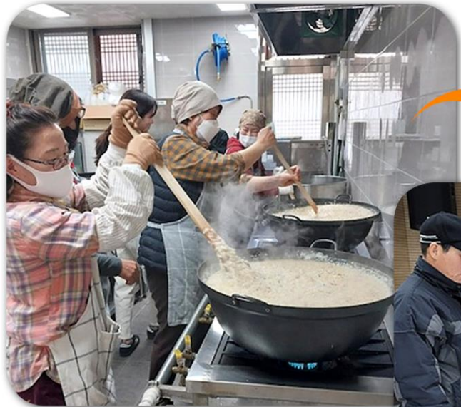
• 조리 •